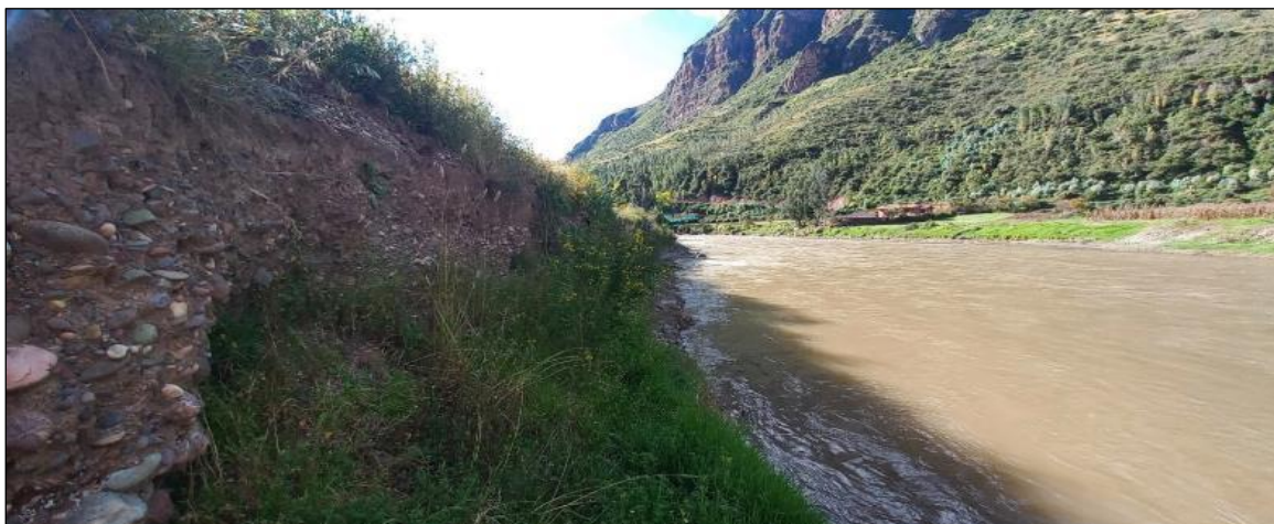
FOTOGRAFIA N°02: BASE DEL TALUD DEL RIO SE OBSERVA EL SOCAVAMIENTO Y EROSION DEL MISMO EL CUAL DEBILITA Y PODRIA AFECTAR A LA INSTITUCION EDUCATIVA DE CCOSCCO AYLLU.