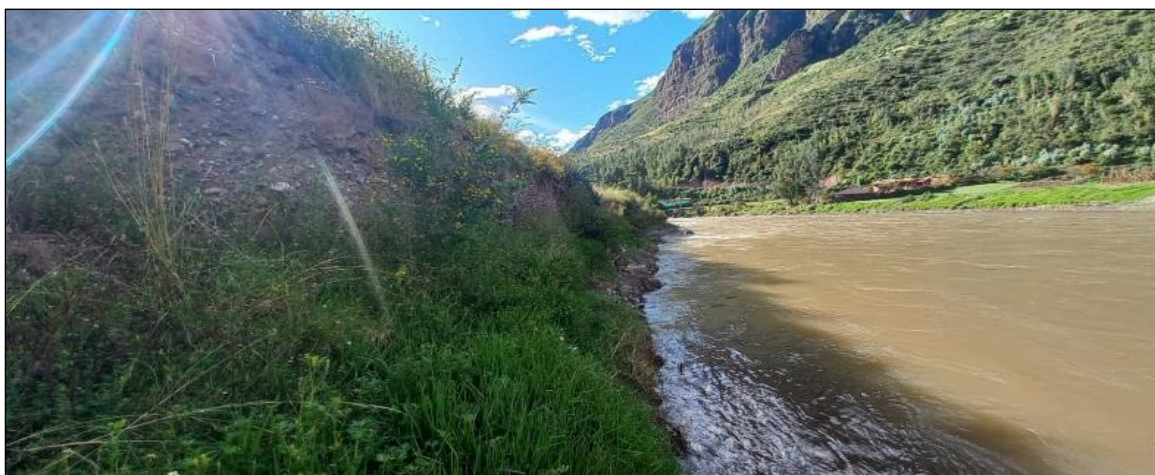
FOTOGRAFIA N°03: BASE DEL TALUD DEL RIO VILCANOTA MARGEN IZQUIERDA, SE OBSERVA EL SOCAVAMIENTO Y EROSION DEL MISMO EL CUAL DEBILITA Y PODRIA AFECTAR A LA INSTITUCION EDUCATIVA DE CCOSCCO AYLLU.