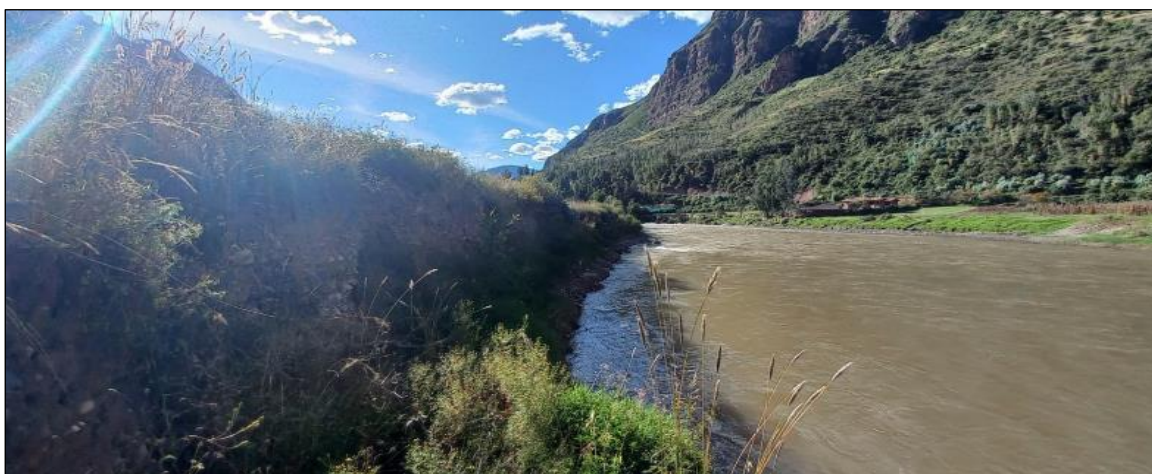
FOTOGRAFIA N°01: BASE DEL TALUD DEL RIO SE OBSERVA EL SOCAVAMIENTO Y EROSION DEL MISMO EL CUAL DEBILITA Y PODRIA AFECTAR A LA INSTITUCION EDUCATIVA DE CCOSCCO AYLLU.